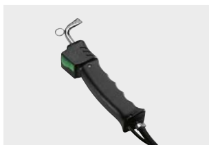
Pistola vapore Steam pistol