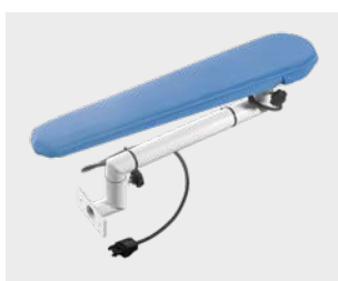
Braccio stiro aspirante e riscaldato Vacuum and heated ironing arm